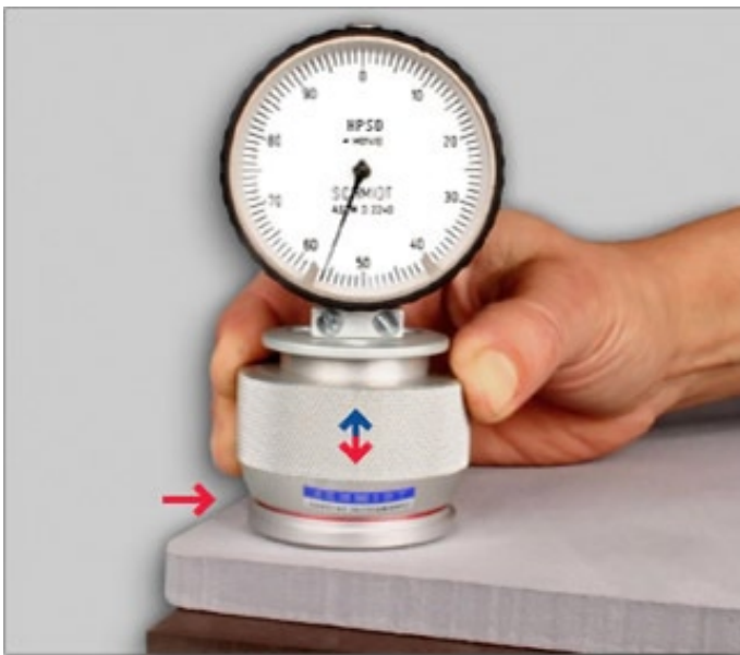
Durômetro Shore HPSD

Durômetro para determinar a rigidez da superfície de borrachas duras, termoplástico rígido, resopal e materiais plásticos duros.